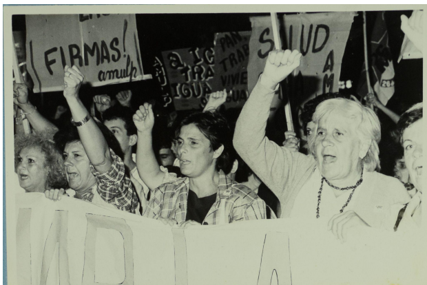
Foto-1_1-(anverso) En el reverso dice: “8 de marzo. Dia internacional de la Mujer”, Fotógrafa Nancy Urrutia. Formato 10 x 13.

→ 13 fotos de la caja 9, titulada “Fotos IV”.