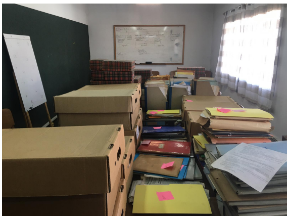
Archivo ASU 20. “Volumen y soportes al finalizar el trabajo”