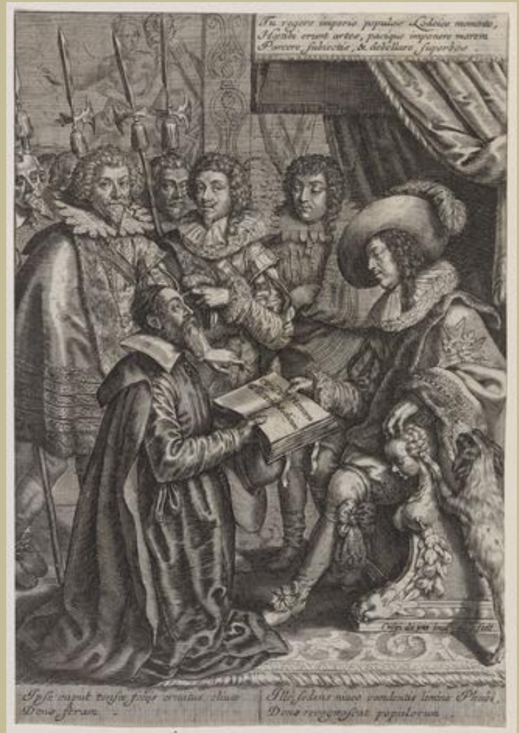
El médico Jean Riolan presenta su libro de anatomía a Luis XIII. Grabado de Crispin de Passe († 1637), París, Denys Moreau, 1626.