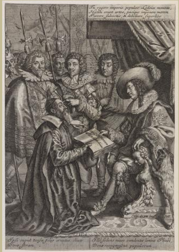
El médico Jean Riolan presenta su libro de anatomía a Luis XIII. Grabado de Crispin de Passe († 1637), París, Denys Moreau, 1626.